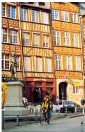
Place du Champ-Jacquet à Rennes.

La rigole de Boulet : 17 km de promenade à pied ou en VTT de l'étang de Boulet au canal d'Ille-et-Rance en passant par Dingé.