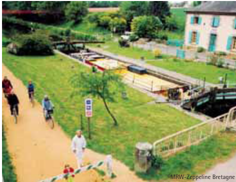
Écluse de Gromillais à Québriac.