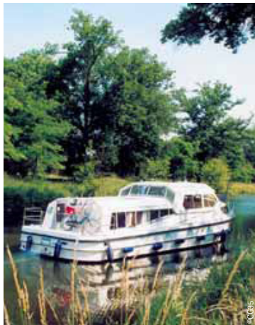
Découverte de l'Ille-et-Vilaine au fil de l'eau.