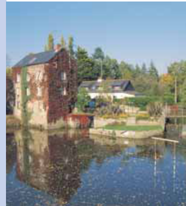
Le canal d'Ille-et-Rance à Saint-Grégoire.

Tinténia : tous commerces – marché le mercredi matin. Hébergement : hôtel, camping.